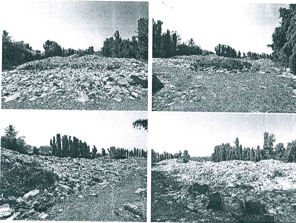
ภาพถ่ายแสดงขยะมูลฝอยตกค้างสะสมจากสถานที่ทิ้งขยะของเทศบาลตำบลห้วยเหนียว

งานสุขาภิบาลและอนามัยสิ่งแวดล้อม สำนักปลัดฯ เทศบาลตำบลห้วยเหนียว ได้เล็งเห็นความสำคัญของปัญหาดังกล่าว จึงได้จัดทำโครงการขนย้ายขยะมูลฝอยตกค้างในบ่อขยะเทศบาลตำบลห้วยเหนียว ประจำปี 2565 ขึ้นมา